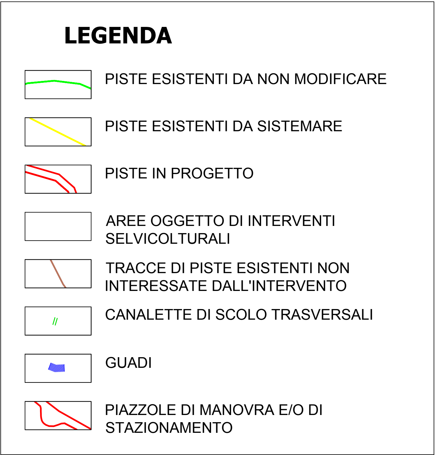
PLANIMETRIA PISTE 3 - 4 - 5 - 6 - SCALA 1:1.000